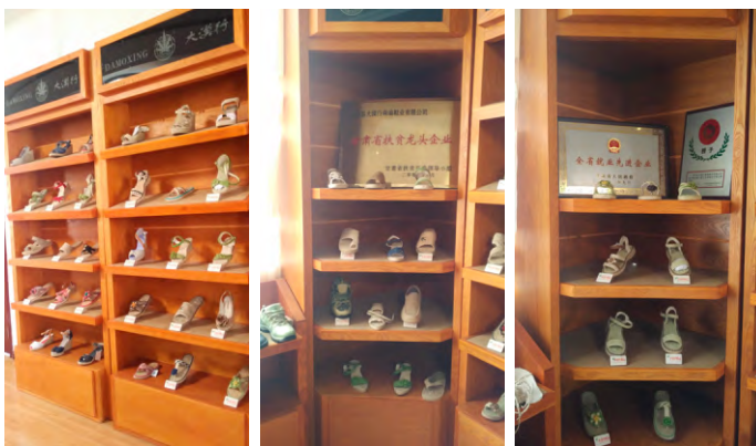
图5 “大漠行”麻鞋

初如棉、坚固似铁，恰如牛皮，非常适合于走远路及山路，穿者日行数里，脚无不适，因而千百年来常盛不衰。古代需肩挑畜驮运输物品，甘谷人四处闯荡，穿的便是麻鞋。 [1]