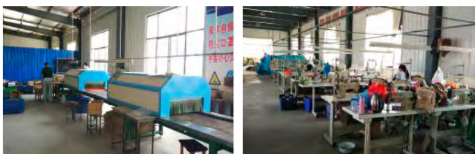
图4 “大漠行”麻鞋内产(手工+机械)