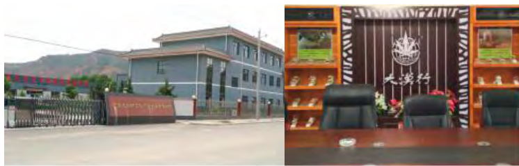
图3 甘谷县大漠行麻编鞋业有限公司