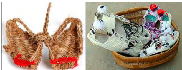
图2 甘谷民间传统麻鞋