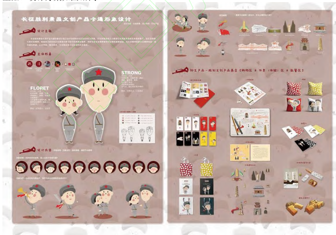
图6 设计方案 Fig 6 Design case

本文以甘肃省长征胜利景园文创产品卡通形象设计为例，按照本文设计流程及方法进行设计。第一步，笔者搜集了大量关于甘肃地区红色旅游、文化、历史人文方面的资料，明确主题，并围绕不怕困难、无坚不摧的长征精神进行原型素材分析与筛选。第二步，以一男一女两位红军战士为原型展开主体卡通形象、标准化线描稿设计，确定CMYK配色值。第三步，以形象名片、表情、动作、使用器物、重要节点建筑为要素，填补主体形象的内容。第四步，规划购物区、休息(体验)区、就餐区三种情景体验模式的文创产品商店，设计与之有关的衍生品。设计方案如图6所示。