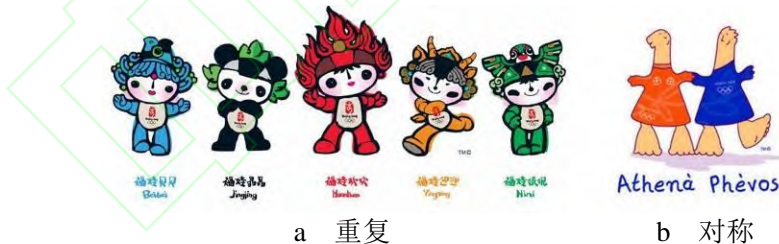
图 3 重复和对称

贡布里希用实验(中断检测仪)证明了“仅仅重复同样的刺激不会引起外部反映。”因此，重复中寻求视觉显著点则更能提高设计的趣味性，同时在重复的样式与视觉显著点之间保持平衡，使受众的视觉认知不会因为太多视觉显著点而超负荷。如 08 年北京奥运会的“福娃”均以中国的大头娃娃为原型进行再设计，分别运用水与鱼纹图案、熊猫与宋代瓷器莲花造型、敦煌壁画的火焰图案、藏羚羊的形态、北京传统的沙燕风筝形态，在重复的中国大头娃娃形象中寻找各自的特征变化，使得五个福娃各有特色、和而不同，见图 3a。