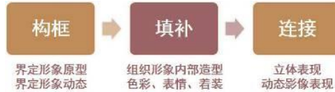
图 1 文创产品卡通主体形象设计过程