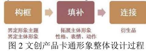
图 2 文创产品卡通形象整体设计过程