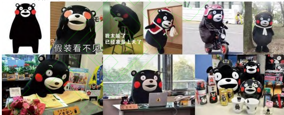
图 5 时空 Fig 5 Time and Space

如日本熊本县的“熊本熊”就是一个非常成功案例，一方面，突破了“熊”本身的恐怖印象，设定呆萌、憨厚的性格，让人耳目一新；另一方面，制作大量的表情包、玩偶、日用品等衍生产品 [7] ，广泛传播，受人青睐，见图 5。